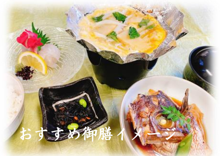
おすすめ御膳イメージ