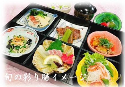
旬の彩り膳イメージ