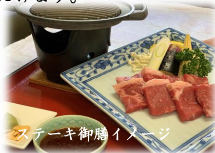
ステーキ御膳イメージ